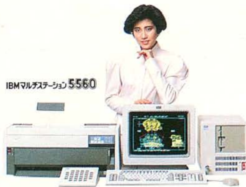
IBMマルチステーション5560

Automation)シリーズ>新登場。デジタル回路設計のためのCADシステム。ロジック回路設計用<PC-CAPST™>、プリント回路基板設計用<PC-CARDS™>、ロジック回路シミュレーション用<PC-LOGST™>から構成…。ことしもパソコンCADをリードする、IBMマルチステーション5540/5550/5560。お問合せは、弊社営業担当員、IBM OAセンター、IBM特約店までどうぞ。*CADAM社の商標です。 **Personal CAD Systems社の商標です。